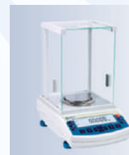
Modelo Legibilidad Carga máx BAS 31 plus 0,0001 g 220 g